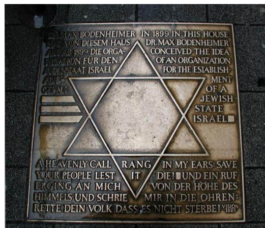
Gedenktafel für Max Bodenheimer, Richmodstr. 6, Köln

Wer heute die Kölner Richmodstraße entlang geht, kann sie kaum übersehen: Vor dem Haus Nr. 6 liegt eine große, bronzene Gedenktafel. Genau hier lebte Max Bodenheimer, geboren 1865 in Stuttgart. Nach dem Studium in Tübingen, Leipzig, Straßburg, Freiburg und Berlin ließ er sich 1890 als Rechtsanwalt in Köln nieder und eröffnete eine sehr erfolgreiche Kanzlei. Bald machte er sich einen Namen mit seinen revolutionären Gedanken: in seiner viel beachteten Schrift „Wohin mit den russischen Juden?“ schlug er schon 1891 die Gründung jüdischer landwirtschaftlicher Siedlungen in Palästina vor. Wenige Jahre später fasste Bodenheimer dann – gemeinsam mit einem Kölner Mitstreiter, dem Kaufmann David Wolffsohn – seine Überlegungen in einer kurzen, prägnanten Formel zusammen: „Juden aller Länder, vereinigt euch!“ Es gehe darum, so Bodenheimer in den sogenannten „Kölner Thesen“, für die über die Welt verstreut lebenden, immer wieder verfolgten Juden einen eigenen Staat zu gründen, welcher sich auf dem Gebiet Palästinas befinden müsste. Anklang fanden die Thesen bei dem Wiener politischen Aktivisten und Publizisten Theodor Herzl, um den sich schließlich die weltweit immer zahlreicheren Anhänger dieser Thesen scharten. Es entstand eine Bewegung, die Geschichte schreiben würde: der Zionismus.