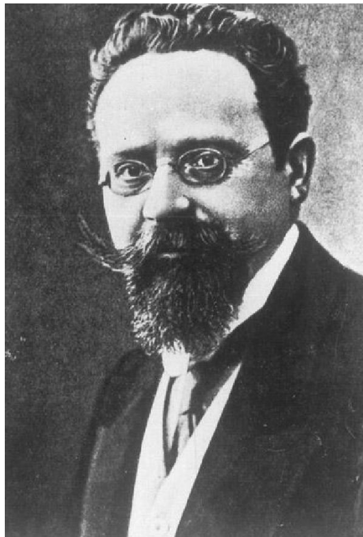
Max Bodenheimer, um 1911

Vor 1900 machte sich Ernüchterung, ja Enttäuschung unter den jungen deutschen Juden breit. Hatten ihre Mütter und Väter noch 1871 begeistert ihre neue politische Gleichstellung begrüßt und sich hoffnungsvoll in das junge Kaiserreich eingebracht, so erlebte die Generation der Töchter und Söhne nun einen immer wieder neu aufflammenden Antisemitismus, erniedrigende Behinderungen im Arbeitsleben, demütigende Behandlungen als Außenseiter, und das bittere Gefühl, aus der Gesellschaft ausgeschlossen zu bleiben. Mehr und mehr wuchs der Wunsch nach einer ausdrücklich jüdischen Selbstverwirklichung – ob nun in Deutschland oder, noch besser und freier, in einem eigenen jüdischen Staat.